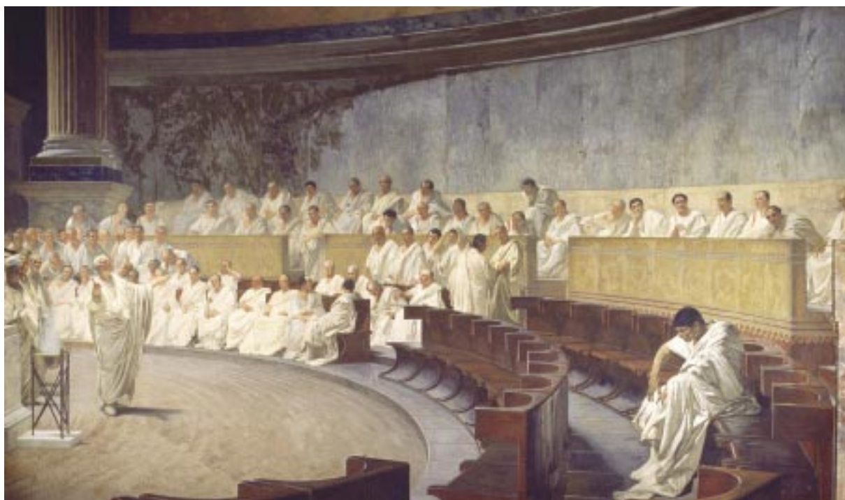
Tirone e altri stenografi da lui formati con la loro arte hanno consentito di conservare molti discorsi di Cicerone, tra i quali l'atto d'accusa contro Catilina, descritto da Cesare Maccari (1840-1919) in un affresco che decora una sala del Senato Italiano.

I colleghi italiani vi aspettano e faranno di tutto per rendere questo Congresso indimenticabile... senza dimenticarsi di Tirone.